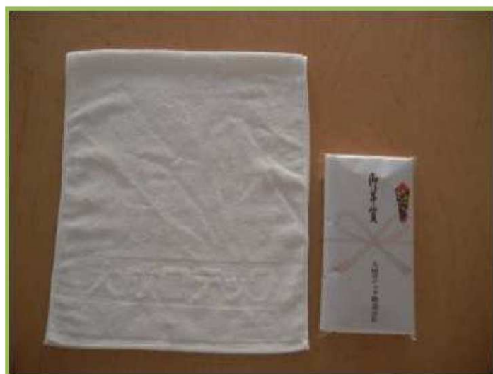
【大成ロテックロゴ浮き出し今治高級タオル】

「御年賀」「記念品」「粗品」等にのしを変えることにより、安全大会のみならず、営業挨拶・近隣挨拶・工事挨拶など各場面で活用できます。100本単位の形でご注文をお受けできますので、様々なご活用をご検討されるようお願い申し上げます。