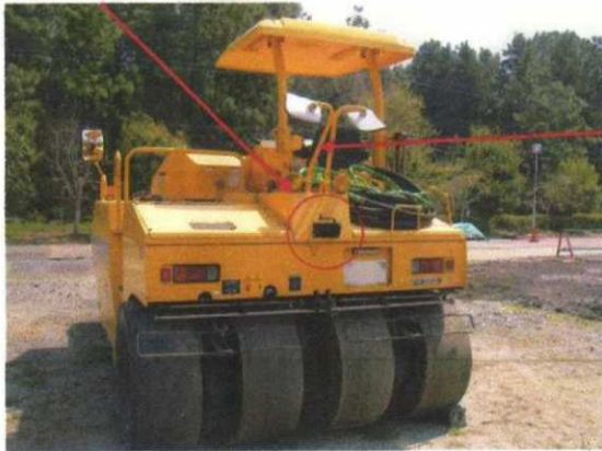
みはりセンサー(赤外線発光器)