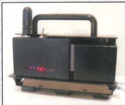
みはりセンサー(赤外線発光器)