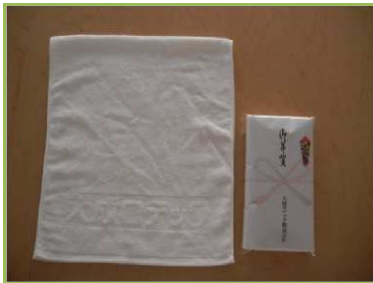
【大成ロテックロゴ浮き出し今治高級タオル】

「御年賀」「記念品」「粗品」等へのしを変えることにより、安全大会のみならず、営業挨拶・近隣挨拶・工事挨拶など各場面で活用できます。100本単位の形でご注文をお受けできますので、様々なご活用をご検討されるようお願い申し上げます。