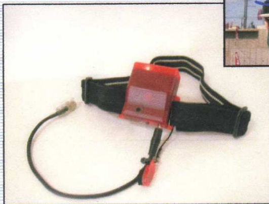
ヘルセンサー(作業員側) 赤外線受光+電波線発信器