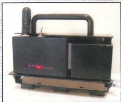
みはりセンサー(赤外線発光器)